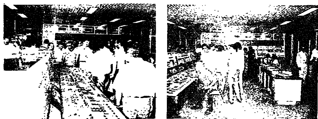
اجراء التجربة الاولى لاعادة تشغيل الوحدة الاصطناعية

في خطوة من المقرر ان تشمل بيروت بشطريها تدريجيا بالموازاة مع اصلاح الشبكة العامة. عاد التيار الكهربائي الى مناطق كسروان وجبيل، واعاد رئيس مجلس ادارة مؤسسة كهرباء لبنان المهندس الياس النمار انه تنفيذاً لتوجيه وزير الموارث والكهربائية اللواء الركن عصام ابو جبر. بدأت المؤسسة بتفعيل المجموعة رقم ١ في معمل الزوق الحراري لإنتاج الطاقة الكهربائية لتزويد مناطق كسروان وجبيل بالصحة وتعمل المصلحة الحيوية من ماء وهاتف ومصانع ضمن الامكانيات التي يسمح بها وضع الشركات والمخاطبات بعدما تعرضت له من قصف وتدمير. وتعمل المصلحة جاهدة على تنفيذ اصلاحات اللازمة ليصل التيار الكهربائي تدريجياً الى كل المناطق أولاً من المصنمين على الارض في المحافظة على المنشآت الكهربائية ومعداتها.